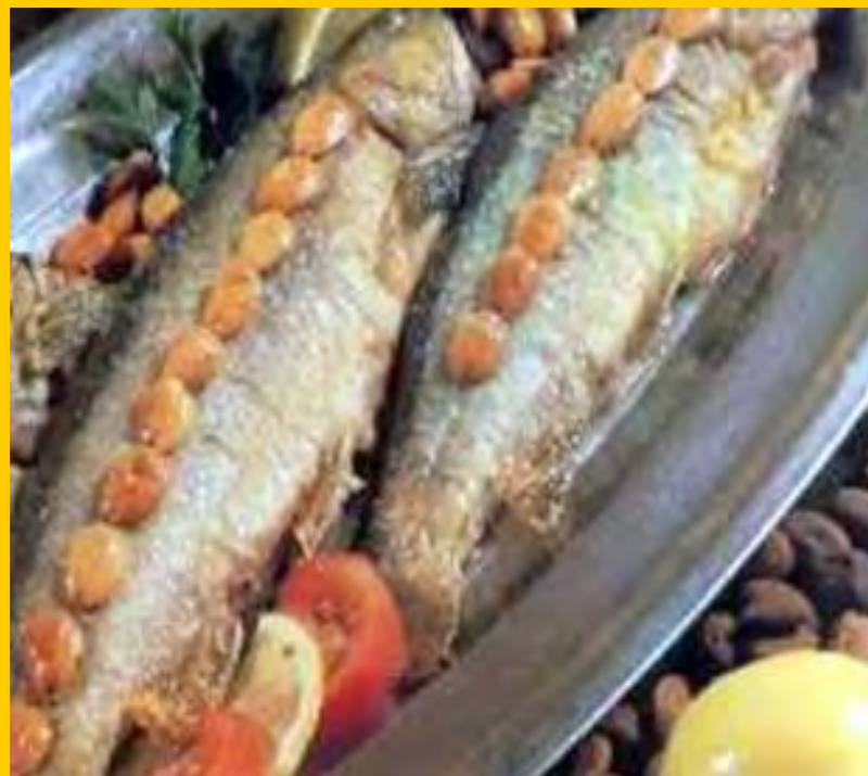
Охридска пастрмка со бадеми