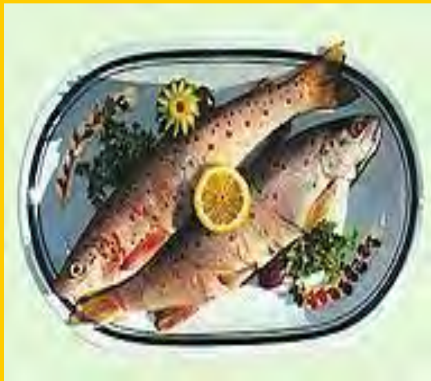
Охридска пастрмка која „пливала само во две води,,.