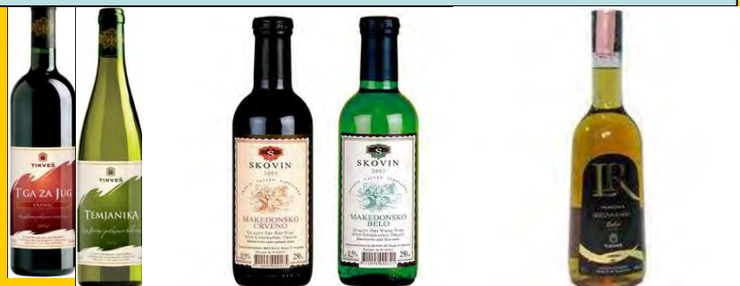
Ајде да наздравиме